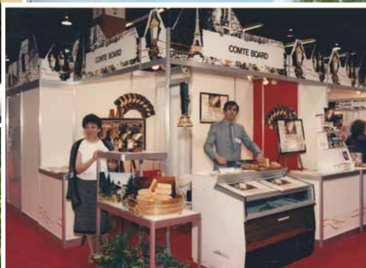
Tout le monde met la main à la pâte pour assurer la promotion de ce bon produit jusqu'aux États Unis!