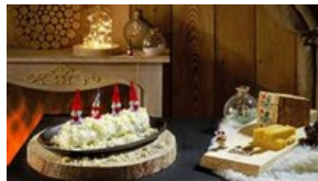
Bûche de Noël au Comté