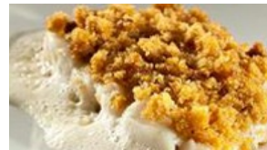
Dos de sandre poêlé aux épices de Noël, crème au Comté