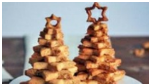
Mon beau sapin au Comté