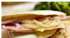
Quesadillas Comté et fenouil