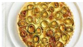
Tarte fleurie au Comté