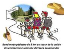
Randonnée pédestre de 8 km au coeur de la vallée de la Serpentine jalonnée d'étapes gourmandes