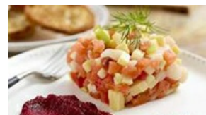
Tartare de truite fumée, Saint-Jacques et Comté