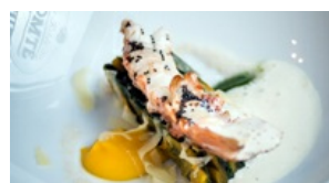
Langoustine, épinards, Butternut et Comté