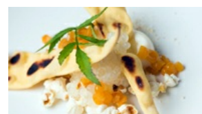
Maïs et Comté