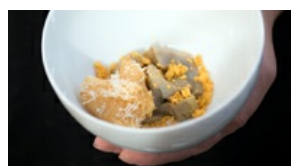
Artichaut, Café et Comté