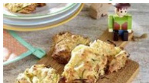
Cookies Comté, courgette et menthe