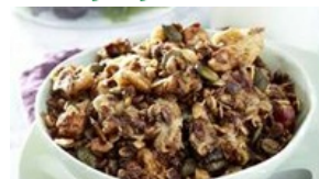
Granola au Comté