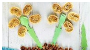
Palmiers au Comté et noisette