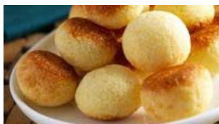
Paes de queijo au Comté

Viva Brasil pour ces petits pains traditionnels revisités au Comté ! À déguster sans modération à l'apéritif !