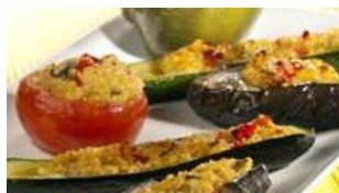
Farcis au Comté et quinoa

Viva Brasil pour ces petits pains traditionnels revisités au Comté ! À déguster sans modération à l'apéritif !