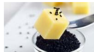
Accord Comté et Nigelle

Les traditionnels farcis de l'été, réinterprétés au Comté et au quinoa... ksss ksss ksss... on entend déjà les cigales !