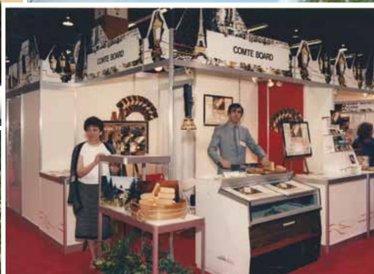
Tout le monde met la main à la pâte pour assurer la promotion de ce bon produit jusqu'aux États Unis!