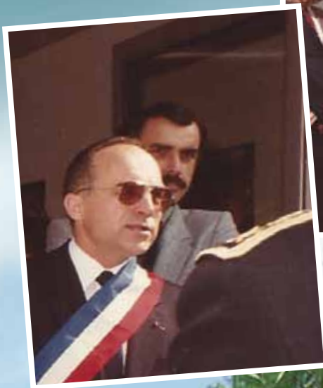
Lors de la visite d'Henri Nallet, ministre de l'Agriculture, le 1 er juin 1985. Jean-Jacques a encore la moustache.