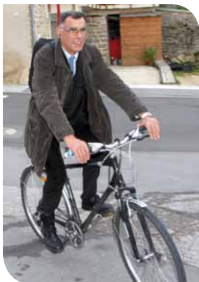
Toujours à vélo (il préfère le Vélib au métro) et toutes ses affaires sur le dos !